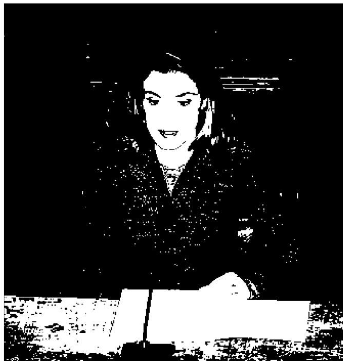
Letizia Ortiz, ayer, dando la palabra a los primeros ponentes del IX Congreso de Académias Iberoamericanas.

De vez en cuando, Letizia miraba de reojo a los papeles que tenía sobre la mesa, que le recordaban los seis puntos del día en los que debía intervenir directamente. Para no perderse, Letizia llevaba anotados en los cuatro primeros puntos, además del «Se abre la sesión»