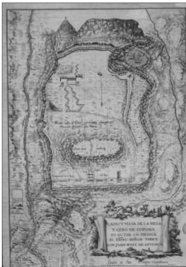
Fig. 3. Plano y vista de la Mesa y Cerro de Coporo en Michoacán. 1816.

La cartela del título y de la dedicatoria ofrece una filacteria ornada con rocas, árboles, arbustos y en la base instrumentos de cartografía: brújula, compás, libro y pliego de papel con la fecha: «Año de 1816». La fortaleza estaba sitiada por las tropas realistas. En la parte superior se alza la fortaleza de los rebeldes con cuatro baluartes y su cortina, su campamento y varias veredas. Más abajo, en la «Mesa sobre el Cerro de Coporo, elevada del plan del río como 600 varas», se localizan la trinchera, las baterías reales y los ramales del camino cubierto para la formación de la trinchera y baterías del Rey». Al sur se levanta el campamento de las tropas reales. En el llano, por la parte inferior izquierda, se encuentran el pueblo y el río de Jungapeo, zonas de cultivo, caminos y veredas. A la derecha, el arroyo del Coporo y el rancho del mismo nombre 21 .