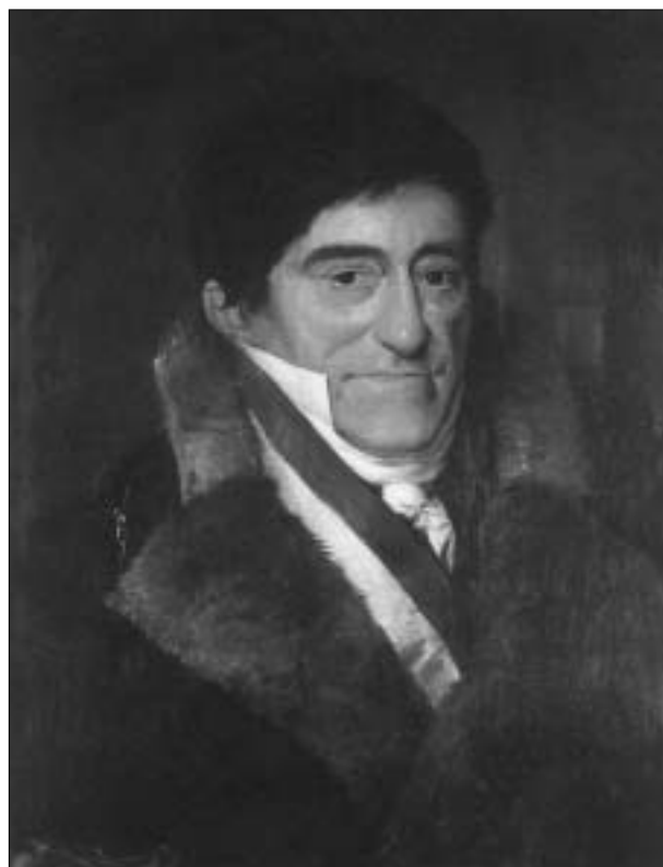
Retrato de Juan José Ruiz de Apodaca y Eliza. Antonio María Esquivel. 1834.