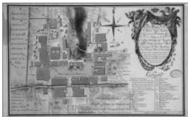
Fig. 10. (1) Plano de la villa de Guadalupe representando la inundación que sufrió en septiembre de 1819.

El 27 de septiembre de 1819 se produjo una inundación en la Ciudad de México 55 . El virrey supo reaccionar a tiempo y evitó una catástrofe como la ocurrida en 1673. Rescató con canoas a la población afectada de los arrabales y del campo y tomó medidas preventivas, como la construcción de malecones. En la colección de Ruiz de Apodaca conservamos una vista y un plano de la villa de Guadalupe , que sufrió la misma inundación (Figura 10) 56 .