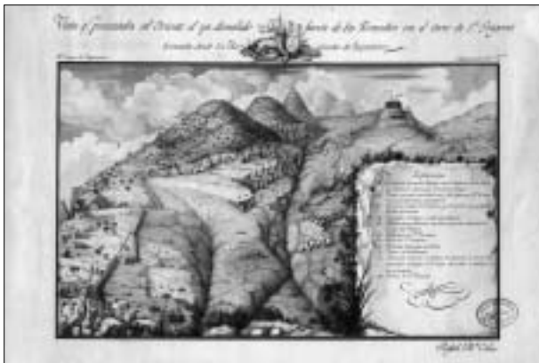
Fig. 8. Vista que presentaba al Oriente el ya demolido fuerte de los Remedios en el cerro de San Gregorio, tomada desde la Hacienda de Tupataro. Real Cuerpo de Ingenieros. Subinspección de Nueva España. Rafael María Calvo. 1818

Todos estos detalles de la operación se explican en la vista del ya demolido fuerte , tal y como estaba el primero de septiembre de 1817, cuando las tropas de Liñán sitiaban el fuerte 46 . Por entonces, las tropas realistas habían penetrado por la cumbre de la cruz del Sauce al cerro del Bellaco , que dominaba a tiro de armas la fortificación más alta de Tepeyac, y se habían apoderado de la casa fuerte llamada la Garita, que defendía la entrada de la cañada por el llano de San Gregorio. La noche del primero de enero de 1818, el fuerte de los Remedios se rinde a Pascual de Liñán, según se indica en el título del plano y de los terrenos que lo circundan.