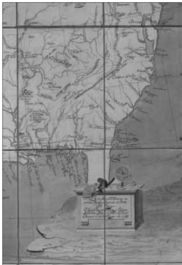
Fig. 4. Plano de las provincias internas de Nueva España. José Caballero, capitán de Artillería provincial de Nueva Vizcaya. 1817. Detalle de la cartela.

El plano de las provincias internas de Nueva España fue levantado por José Caballero, capitán de Artillería provincial de Nueva Vizcaya en 1817, quien lo dedica al virrey Ruiz de Apodaca (Figura 4).