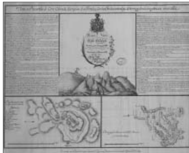
Fig. 5. Plano y vista de la fortificación de Cerro Colorado en Puebla. 1817.