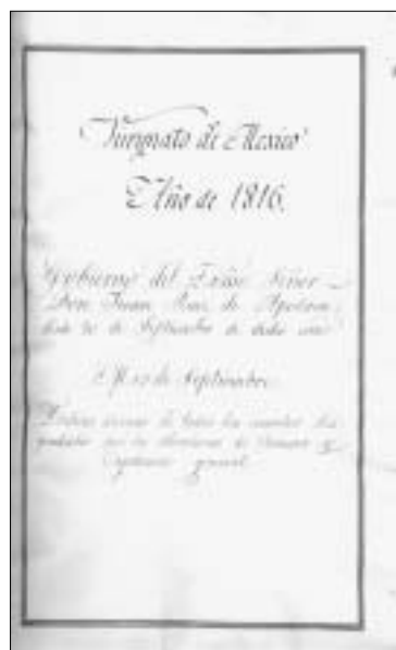
Fig. 2. Virreinato de México. Año de 1816. Gobierno del Excmo. Sr. D. Juan Ruiz de Apodaca desde 20 de septiembre de dicho año. Índices diarios de todos los asuntos des- pachados por la Secretaría de Cámara y Capitanía General. Portada.

satisfacción», según se lee en su hoja de servicios 11 . El 23 de agosto de 1809 ascendió a teniente general y en el mes de noviembre fue enviado a la embajada de Londres durante tres años para tratar las negociaciones de paz y establecer una alianza fuerte contra Napoleón, a la que se unieron la mayoría de los países de Europa central 12 . Cesó en su misión diplomática el 15 de junio de 1811. Desde Cádiz, en febrero de 1812 recibe el nombramiento de gobernador y capitán general de la isla de Cuba y de las dos Floridas, comandante general del Apostadero de aquellos mares y los de Costa Firme y Golfo de México, y la presidencia de la Audiencia de La Habana. De esta etapa conservamos en la Real Academia de la Historia algunos mapas y planos manuscritos de su colección particular 13 . Su mando en esta colonia fue calificado de «verdadero progreso y humanidad». Fomentó el desarrollo económico, artístico y social de Cuba y de las dos Floridas 14 .