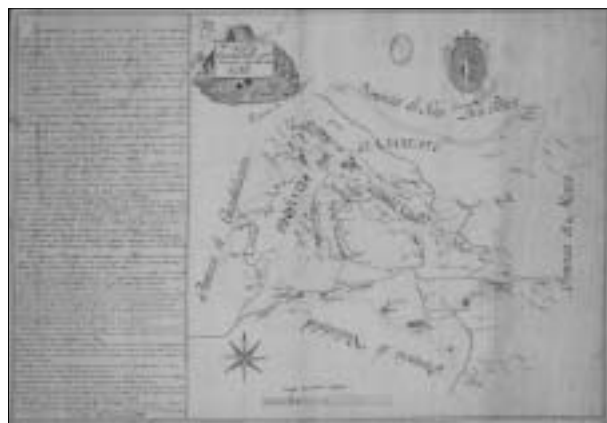
Fig. 6. Mapa que manifiesta la provincia de Guanajuato por los cuatro rumbos. 1816.

El primero de diciembre de 1816 se levantó en la ciudad de México un « mapa que manifiesta la provincia de Guanajuato por los cuatro rumbos » (Figura 6).