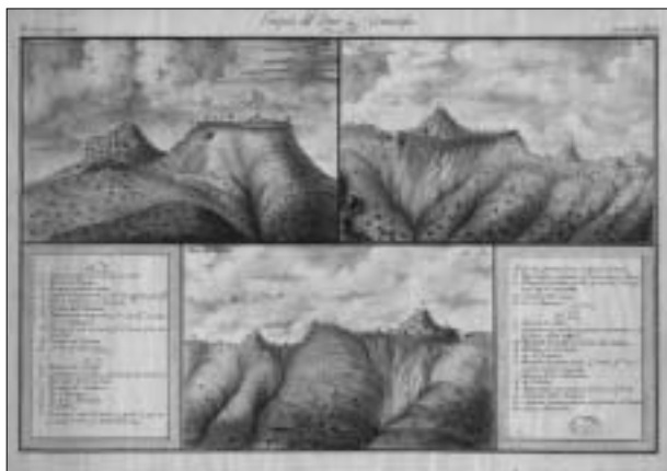
Fig. 7. Croquis del cerro de Comanja. Real Cuerpo de Ingenieros. Comandancia de México. 1817.

manece en la ciudad de Querétaro y prepara el combate. El 24 de julio llega a la ciudad de Guanajuato y a los pocos días recibe la noticia del ataque de Mina a la ciudad de León. A esta ciudad llega Liñán el día 29 y se dispone a formar el plan de operaciones contra el fuerte del Sombrero , situado en el cerro del mismo nombre, en la provincia de Guanajuato, a 20 km de la ciudad de León. Vulgarmente se denominaba fuerte de Comanja . Había sido fortificado por Pedro Moreno y en esos momentos era defendido por el padre Torres, que se titulaba teniente general y jefe de las fuerzas del valle de Santiago y la provincia de Guanajuato. Desde este fuerte y el de San Gregorio se dirigían las operaciones de Mina y sus seguidores. El 24 de junio Mina había entrado en el fuerte del Sombrero. Para evitar bajas por lo agreste del terreno, Liñán decide poner sitio sobre las cuatro leguas de circunferencia del cerro a partir del 31 de julio. El Servicio Histórico Militar conserva un plano del fuerte que se levantó para preparar estas operaciones 41 . Allí se detallan las posiciones de las tropas y las circunstancias geográficas y técnicas del sitio. El diseño de la Real Academia de la Historia es un croquis con tres vistas en el que se identifican las diferentes partes del cerro y fortaleza. En la segunda vista y en el número tres de su tabla explicativa figura el picacho del Sombrero (Figura 7) 42 .