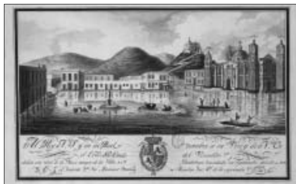
Fig. 10. (2). Vista de la plaza mayor de la villa de Guadalupe inundada en septiembre de 1819.